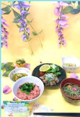
新緑先取りランチ