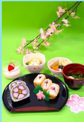
飾り巻き寿司ランチ