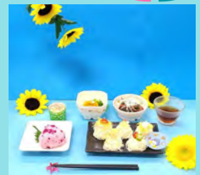
涼を感じる夏ランチ