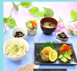
梅雨を乗り切る さっぱりランチ